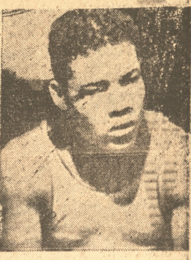
JOE LOUIS 'Presa fácil para Braddock'

EL CABLE ha transmitido hace días la noticia de la anulación del match Schmeling Braddock.