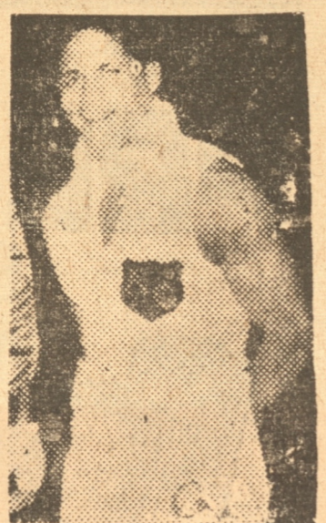
ARTURO GOODOY Es ahora un as mundial del box

Johnston, promotor, de Madison Square Garden, da aquí una lista de los matches que le gustaría ver llevados a cabo en el transcurso de la temporada 1937, sobre la base de esa vieja y famosa "armonía" boxística y cuya concertación se procura.