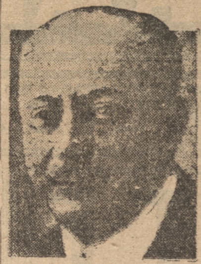
Señor Francisco Garcés Gana, nuevo Ministro de Justicia y Educación

Dice que es amante de la libertad dentro del imperio de la ley y del orden Entrevistado el nuevo Ministro del Interior, señor Cabrera, por los periodistas, expresó: "El Presidente de la República me ha honrado con el puesto de Ministro del Interior y he aceptado en la conciencia de que cumpla con un deber para con el país al cual me propongo servir con todas mis energías, inspirándome absolutamente en la política nacional del Jefe del Estado. Soy un hombre amante de la libertad, dentro del imperio de la ley y del orden y en el servicio de esta causa todos los ciudadanos y todos los partidos políticos tendrán de mí parte las garantías más absolutas."