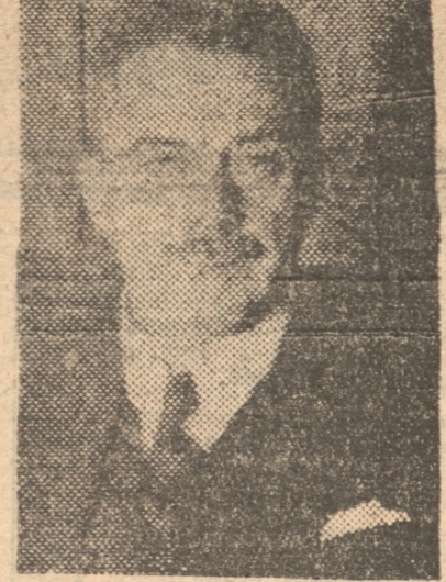
Don Miguel Cruchaga Tocornal que continúa en Relaciones Exteriores

El doctor Castro es un profesional que ha vivido alejado de las actividades políticas. EL SEÑOR BUSCHMANN DESA COOPERAR AL GOBIERNO