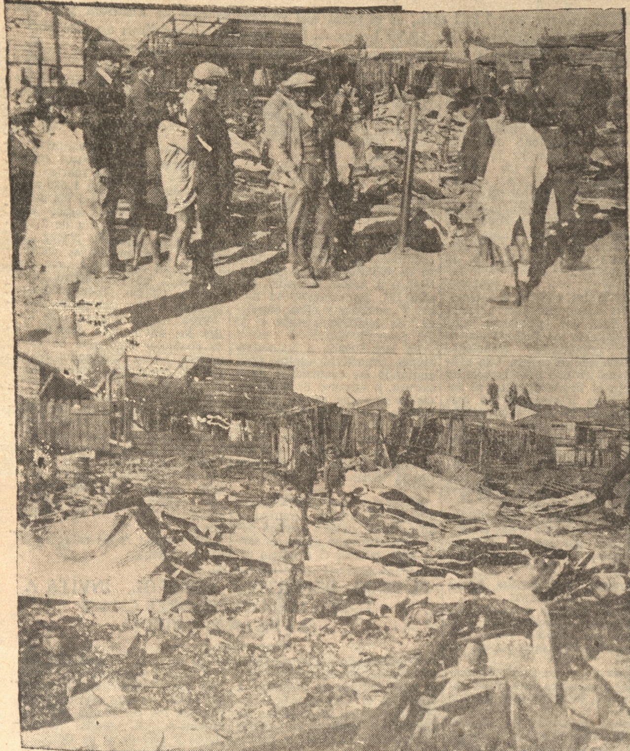
DOS ASPECTOS DE LOS EFECTOS DEL INCENDIO OCURRIDO ANTEÑOCH

La falta de grifos en ese barrio impidió a los bomberos el empleo del agua para sofocar el fuego. — El público es el único culpable de que no haya grifos en algunas partes de la ciudad