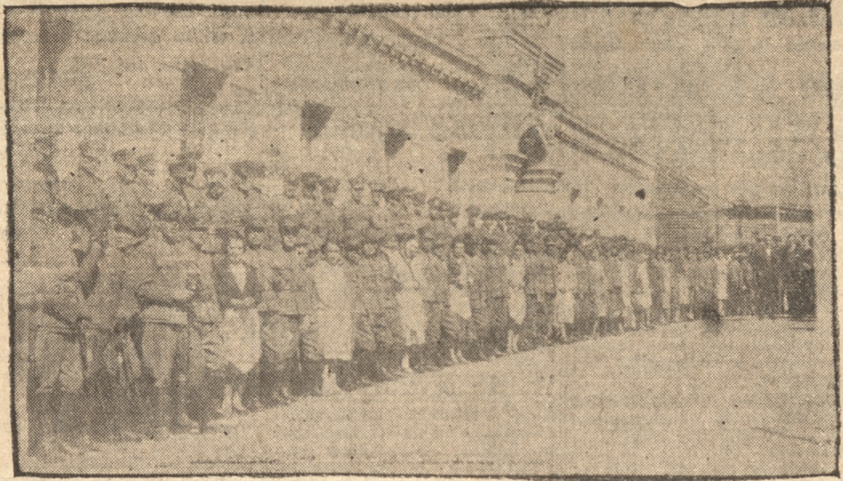
CARABINEROS DE LOTA Y SEÑORITAS QUE LOS ATENDIERON EN EL ALMUERZO

La Asociación de Comerciantes de Lota, que cuenta con más de cien socios, celebró el aniversario Patrio con un banquete en el Hotel Central. Puede decirse que a esta manifestación concurren los elementos más representativos de la