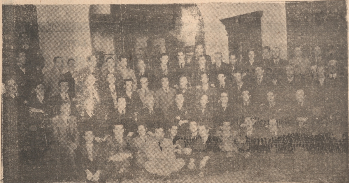
Una parte de los asistentes a la manifestación de anoche en el Centro Español