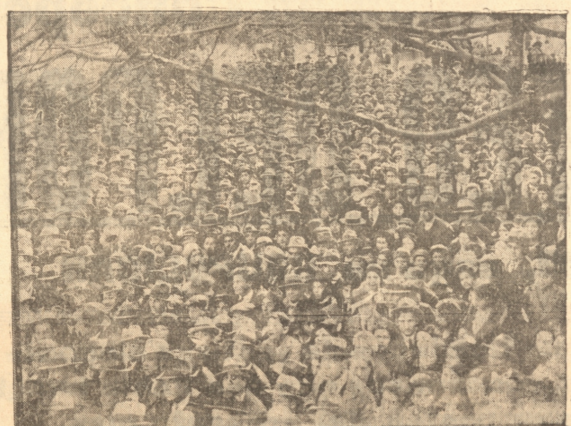
LA INMENSA MUCHEDUMBRE QUE AYER SE REUNIO EN LA PLAZA AL CONOCERSE LA RENUNCIA DEL Sr. IBAÑEZ

SE ORGANIZA UN DESFILE Espontáneamente, y en forma tan rápida que es difícil imaginarlo, en frente de la Escuela de Farmacia, de nuestro diario y de otros locales, donde se podían imprimir noticias, se vieron repletos de público, el que se imponía con grandes muestras de entusiasmo de lo sucedido.