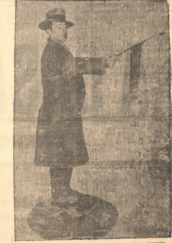
ESTUDIANTE, MIEMBRO DE LA GUARDIA CIVIL, DIRIGIENDO EL TRAFICO