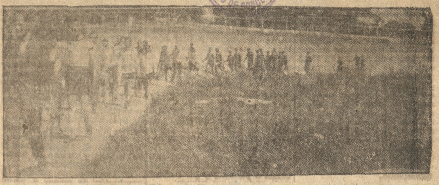
LA TARDE CICLISTA SE INICIO CON EL DESFILE DE LAS DELEGACIONES DE VALPARAISO, SANTIAGO, TALCA, TEMUCO, MAGALLANES Y CONCEPCION

Finalmente Torres es el más discutido. Si gana provoca comentarios y si pierde idem y como es casi invencible a la larga o en lo corto, quedamos en las mismas y mañana seguire-