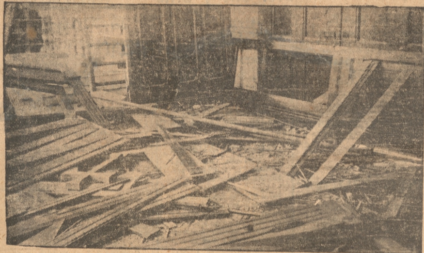
ESTADO EN QUE QUEDO LA MAMPARA EN EL INTERIOR

de lo cual deduce que se ha aprovechado esa hora que sigue al almuerzo en que se ven nuestras calles desiertas. El autor o los autores, aprovechando, también, la misma entrada que les puede ocultar a las miradas de los transeúntes, han colocado así la dinamita que tanta alarma produjo y que pudo haber tenido consecuencias más funestas.