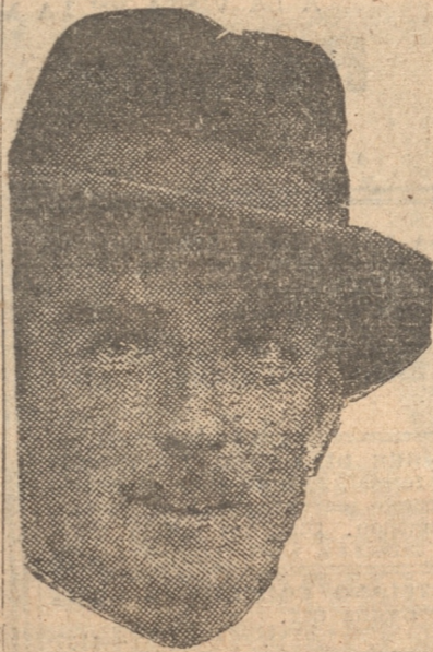
CAPITAN EDEN QUE AYER SE ENTREVISTO CON STALIN Y LITVINOFF

"Aún cuando mi viaje — el primero que efectúa un gobernante británico a Rusia desde 1917 — tenga como único objeto investigar, y de ningún modo negociar, hay sobrados motivos para pensar que este primer contacto personal inicia una época importantísima y llena de esperanzas para las relaciones entre ambos países.