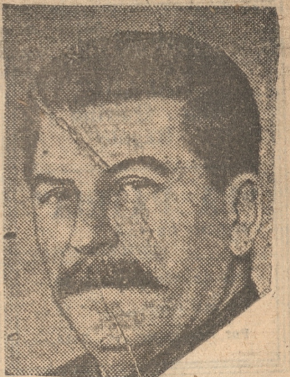
STALIN QUE CONFERENCIO DURANTE MAS DE UNA HORA CON MR. EDEN

"El principal objetivo de la Sociedad de las Naciones es la paz y el mejoramiento de las relaciones internacionales. La paz es también el objeto principal de la política extranjera del Reino Unido. Todos estamos ligados unos a otros por miles de lazos. Estoy firmemente convencido, y esta convicción no se ha debilitado en absoluto en el