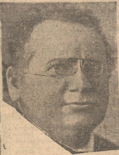
LITVINOFF, COMISARIO DE RELACIONES EXTERIORES DE RUSIA

el Gabinete renunció. MADRID, 29. — (U. P.) — El Gabinete en su mayoría acordó conceder el indulto a González Peña, sobreviniendo luego la crisis total. La mayoría del Gabinete estuvo formada por Lerroux y cinco Ministros radicales, que nes votaron por la conmutación de las penas de muerte. — Ante esto los Ministros de la Acción Popular, agrarios, liberales y demócratas renunciaron obligando así la renuncia total del Gabinete. MADRID, 29. — (U. P.) — El Presidente Excmo. señor Niceto Alcalá Zamora firmó la conmutación de las penas y aceptó la renuncia del Gabinete. MADRID, 29. — (U. P.) — A las 15.45 horas el Presidente del Consejo de Ministros Alejandro Lerroux se encaminó hacia el Palacio de Gobier-