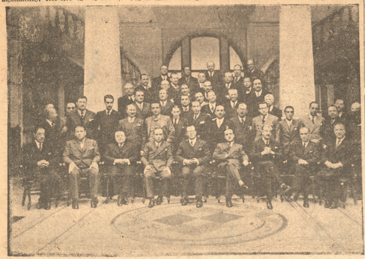
ASISTENTES AL ALMUERZO OFRECIDO POR EL ROTARY CLUB

dependencias para imponerle detallada y detenidamente el funcionamiento de sus servicios.