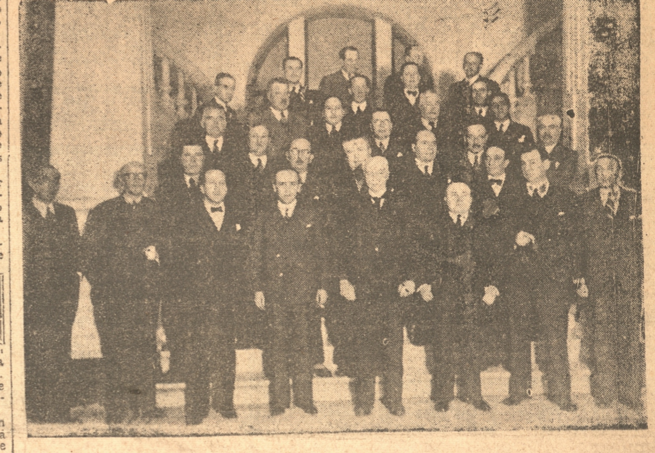
MANIFESTACION QUE SUS AMIGOS OFRECIERON ANO CHE AL MINISTRO

El Sr. Ministro y su comitiva llegarán a Tomé en la tarde. Se desarrollará con motivo de esta visita el siguiente programa: