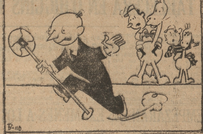
(De "El Romancero de Pipo")

COMENTARIOS EN ITALIA ROMA, 22. — (UP). — Las reformas gubernativas recibidas con calma la noticia de la renuncia del Gabinete francés, porque era esperada.