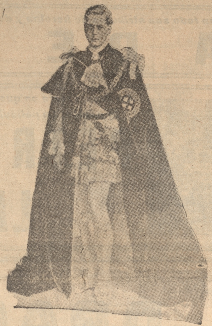
S. M. EDUARDO VIII, vistiendo de las insignias de la Orden de la Jarretiera.

La multitud penetró en fila india a la capilla, donde se encuentra la urna descansando sobre dos caballetes de madera, cubierta con el estandarte real.