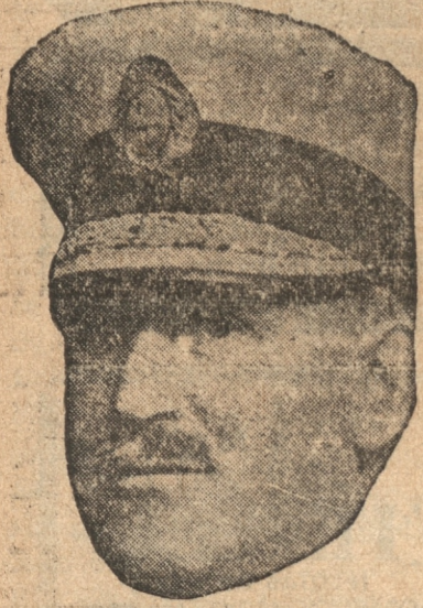
Presidente de Argentina don Agustín Justo

EN LA ESCUELA "ARGENTINA" SE VERIFICARA UN ACTO LITERARIO-MUSICAL. — RECEPCION EN EL CONSULADO. — MANIFESTACION EN HONOR DEL CONSUL ARGENTINO EN EL CLUB DEPORTIVO "FERNANDEZ VIAL". — AUDICION ESPECIAL DE LA "RADIO PHILIPS" AUSPICADA POR "LA PATRIA"