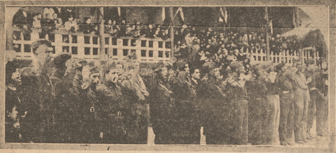
PRESENCIANDO EL DESFILE DE LOS MILICIANOS