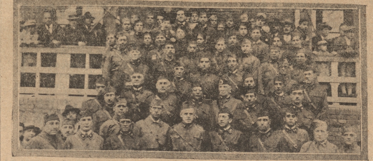
EL GENERAL SCHWARZENBERG CON TODOS LOS JEFES Y OFICIALES

En la estación le despidieron los altos jefes de nuestra ciudad, que agradecieron al señor Schwarzenberg su presencia en las festividades.