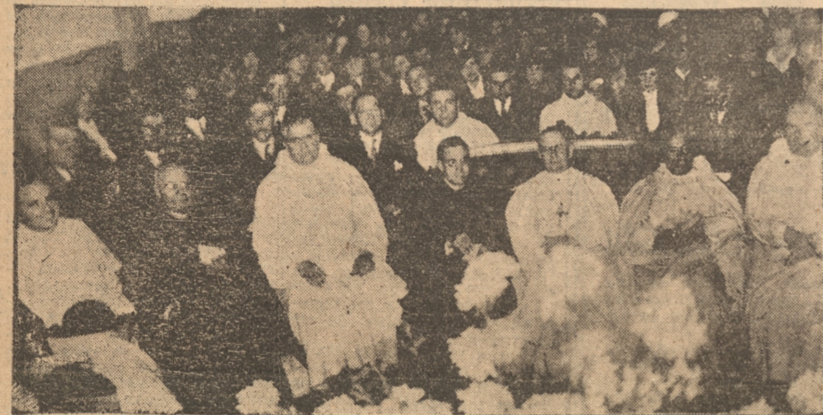
Durante el acto verificado en el Salón del Colegio de los Escolapios

SE CELEBRARON LAS BODAS DE PLATA SACERDOTALES DEL EXCMO. SEÑOR OBISPO DE PODALIA, DR. RAMON HARRISON Y DEL SEPTIMO CENTENARIO DE LA APROBACION PONTIFICIA DE LA ORDEN DE LA MERCED