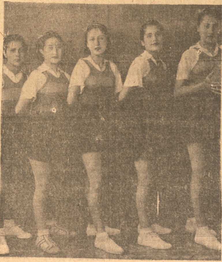
Excelente quinteto femenino de la Escuela Vocacional que se enfrentará en el Horizonte

Tanto el Horizonte como la Vocacional, llegan a la cancha con las probabilidades de hacer suyo el triunfo, y si reconocemos que la Vocacional, cuenta con un cuadro bien entrenado, disciplinado y con grandes jugadoras, también por el otro nos encontramos con cosa casi igual, ya que el triunfo obtenido por el Horizonte el domingo pasado