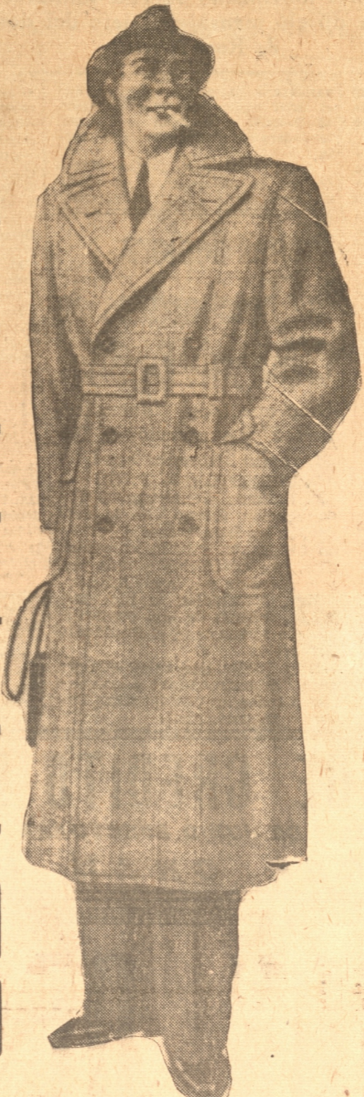
ATRACTIVO Y ELEGANTE MODELO REGIAMENTE TERMINADO, tela escocesa, muy fina, forros de calidad, en variados colores de moda, a