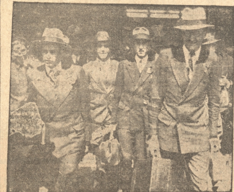
ESTUDIANTES DE LA U. DE CHILE AL LLEGAR A CONCEPCION

Comentando ligeramente añadiremos que si el match fué emocionante.