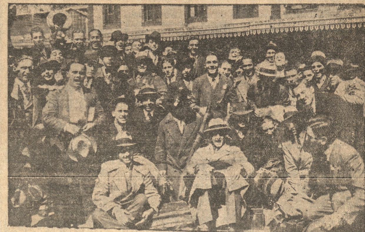
UN GRUPO DE ESTUDIANTES DE LA U. CATOLICA POSA PARA "LA PATRIA" AL LLEGAR

Este encuentro ha despertado el lógico entusiasmo de un match final y del interés de ver actuar al conjunto santiaguino de quien hay excelentes referencias.