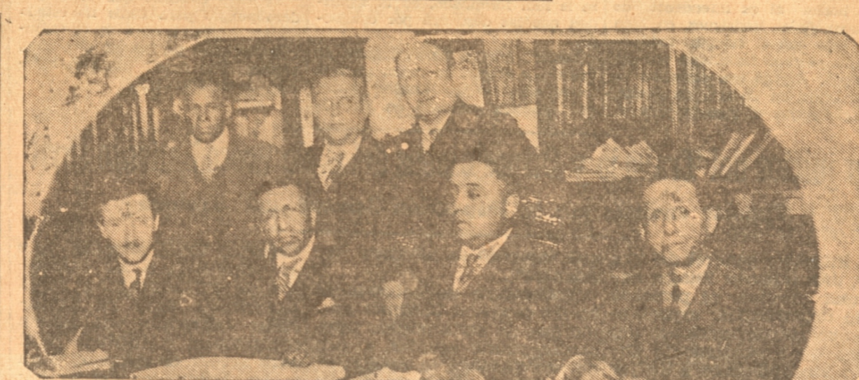
MESA DIRECTIVA DE LA ASAMBLEA DE LA SOCIEDAD "LORENZO ARENAS" EN LA SOC. LORENZO ARENAS

La Comisión del Centro Internacional Obrero de Solidaridad Latinoamericana, ha desarrollado, en el día de ayer diversas actividades en nuestra región.