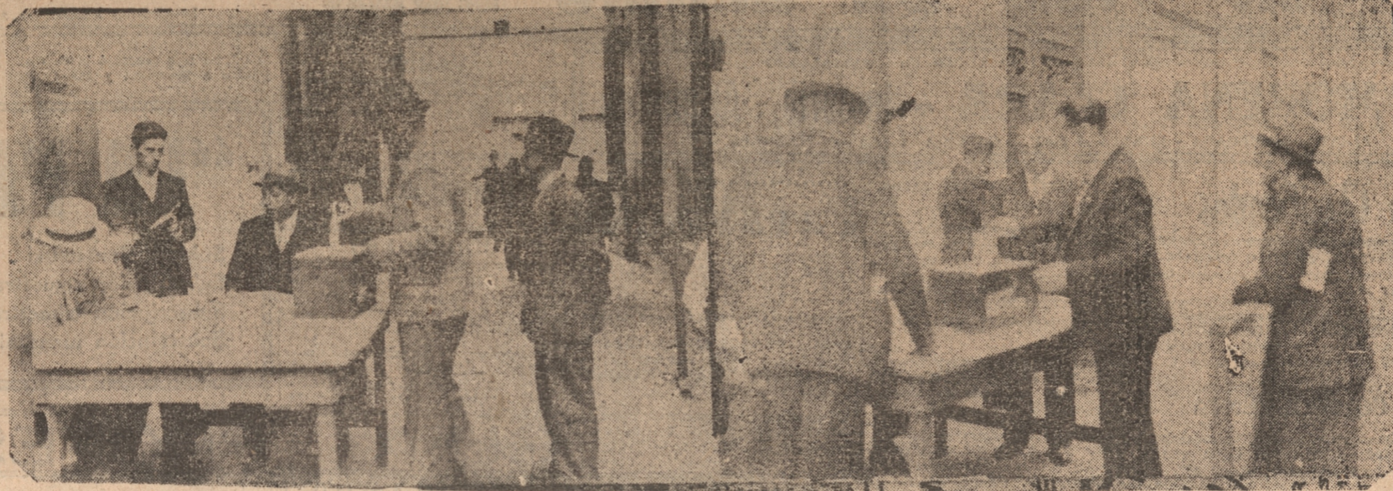
dedor de las 15.30 horas, ya no quedaban más votantes.