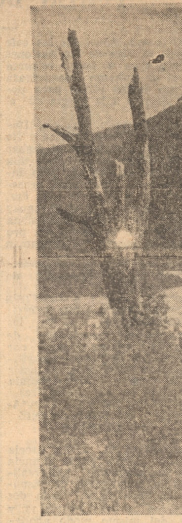
Casa Pangue, en el kilómetro 18 del camino a Argentina

CERCA CENTRAL Dólar 19.37; esterlina 94.55; franco 1.288; franco suizo 6.268; lira 1.644; belga 4.517; marco 7.766; peseta 2.641; corona sueca 4.772; corona checo 0.806; corona danesa 4.229; florin holandés 13.065; schilling austriaco 3.628; oro 400.