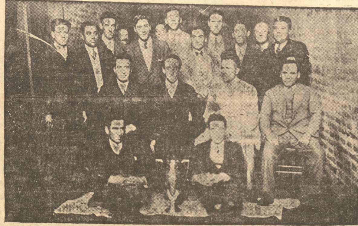
GRUPO GENERAL DE SOCIOS DEL TOME Y PENQUISTA QUE PARTICIPARON EN EL CERTAMEN DE AYER

El club de tiro de Tomé con 2.342 puntos, cumplió ayer una buena performance al ganar al club Penquista, que alcanzó 2.336 puntos.