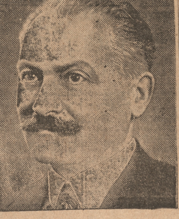
PRESIDENTE DE LA REPUBLICA FRANCESA