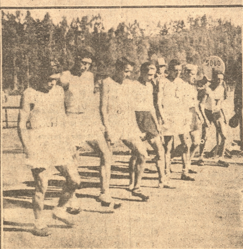
1. — Equipo que representó a Concepción, ganando el Campeonato Atlético de la zona sur. 2. — Equipo ganador de la posta 4 x 400. 3. — Ganadores de los 100 Mts planos que participaron en la carrera 5.000 Metros listos para iniciar la prueba (Fotografías de Bernales).