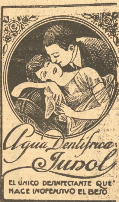
EL ÚNICO DESINFECTANTE QUE HACE INOFENSIVO EL BEBÉ

Abrigos, Capas, Botas, Paraguas y Zapatones OFRECE LA CASA POPULAR, B. Arana 483