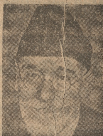
VENIZELOS, que ayer abandonó su país.

"Los esfuerzos del gobierno se dirigiran ahora a reprimir la sedición