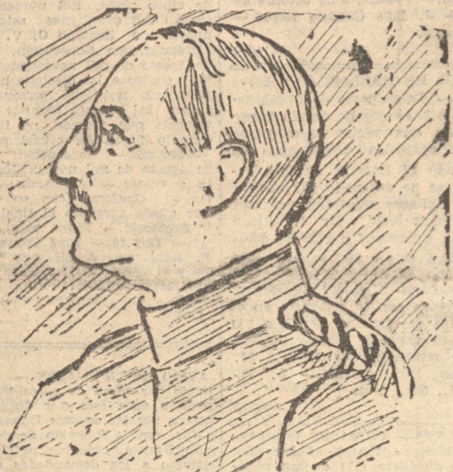
ALEJANDRO I. de Sudeslavia, asesinado ayer

Rey de los serbios, segundo hijo de Pedro Karageorzevich, Alejandro I. nació en Cetina, Montenegro, el 4 de diciembre de 1888. Pasó los primeros años de su vida en Ginebra y en 1899 se trasladó a Rusia, entrando en 1904 en el Cuadro de Cadetes Imperiales.