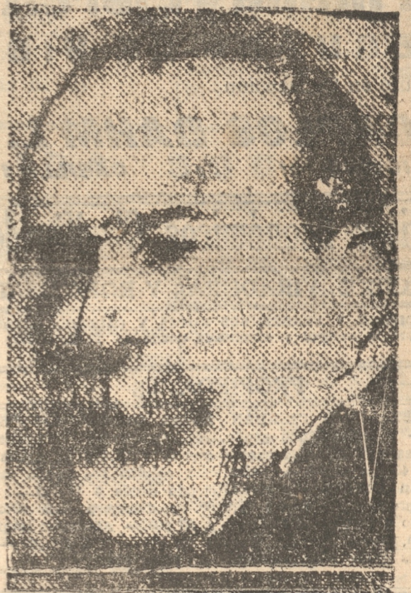
M. LOUIS BARTHOU, que cayó junto con Alejandro

Hombre político y abogado francés M. Juan Louis Barthou, nació en 1862. Ministro a los 32 años, Barthou ha desempeñado, sucesivamente, las carteras de Trabajos Públicos, Interior, Justicia, Instrucción Pública y Relaciones Exteriores. En 1893 fué Presidente del Consejo y su Ministerio obtuvo el voto de la ley de tres años. En 1918 fué nombrado académico.