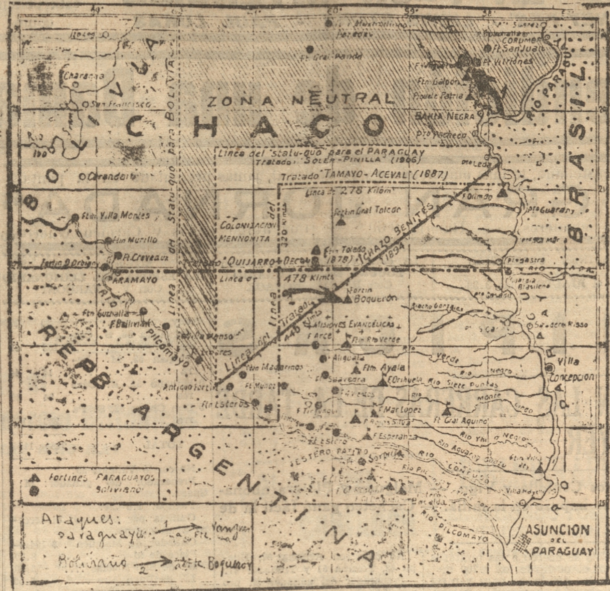
LA FLECHA MARCADA CON EL N.º 2 INDICA EL FUERTE BOQUERON, TROPAS PARAGUAYAS QUE FUE TOMADO POR LAS

Paraguay está concentrando sus fuerzas para el nuevo ataque. — Bolivia responderá hoy o mañana a la última nota de los neutrales