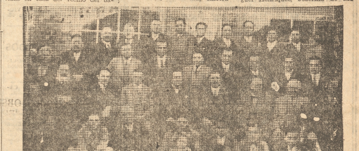
GRUPO DE ASISTENTES A LA MANIFESTACION