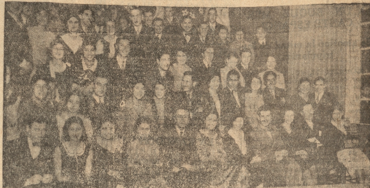
UN GRUPO DE LOS ASISTENTES AL BAILE DE AYER EN LA ESCUELA DE EDUCACION

Se bailó animadamente hasta cerca de las 22 horas