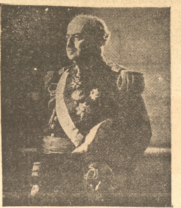
General Oscar R. Benavides.

El 27 de octubre la Liga Franco Italiana le ofrece en París un distinguido banquete, que fue