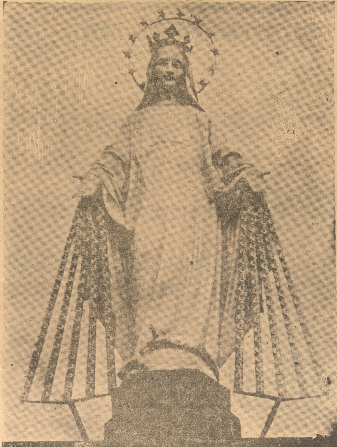
Adán, la perla más preciosa del océano incommensurable de la riqueza divina. María es aquella mujer que ha dado su inspiraciones al arte humano. (PASA A LA PAG. 5)

Gracia plena. Su belleza espiritual dió sonidos admirables a la lira de David, hermosas creaciones a la poesía de Salomón, arreques sublimes a los videntes de Israel. María es