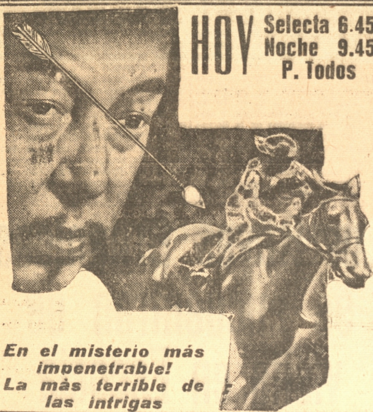
En el misterio más impenetrable! La más terrible de las intrigas

Además, la serial suprema: ADELANTE SOLDADOS