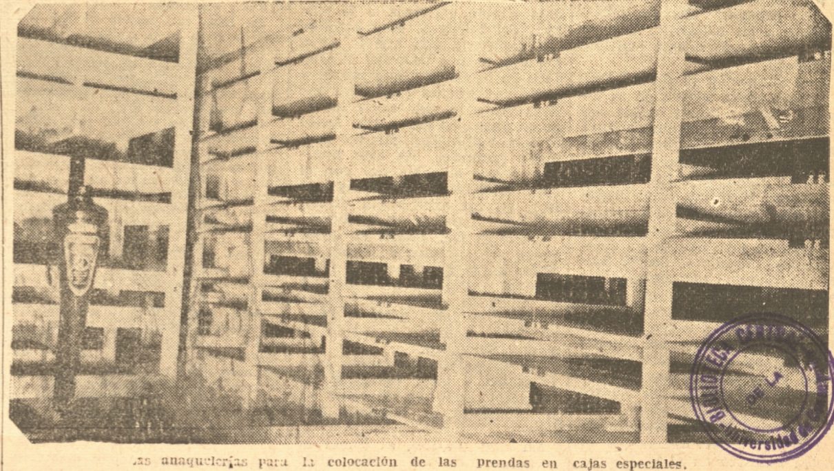
Las anaqueleros para la colocación de las prendas en cajas especiales.

Hay departamentos especiales para cada persona que solicita los diferentes servicios de la institución. Los que van a rescatar prendas, no estarán juntos con los que van a empeñar; y los que no desean no