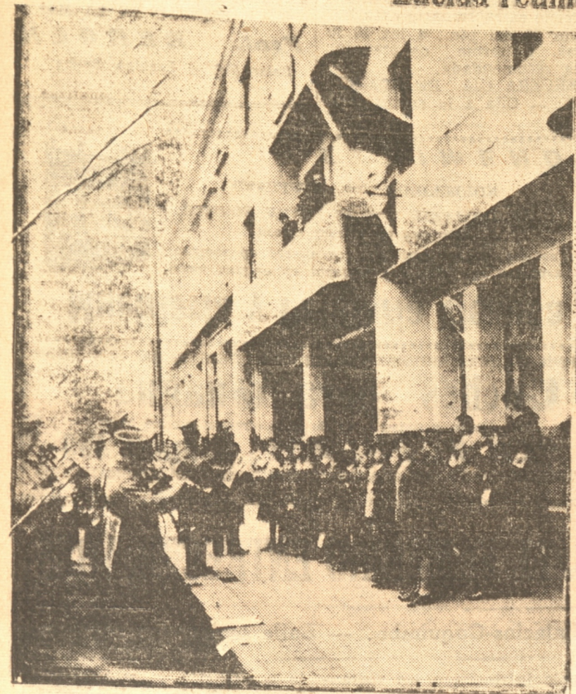
DURANTE EL IZAMIENTO DE LA BANDERA FRENTE AL CONSULADO DEL PERU

En esta gloriosa fecha de mi patria quiero tener el placer de que todos los presentes me acompañen a brindar por la ventura personal de nuestros respectivos mandatarios y por la felicidad e indisoluble unión de Chile y el Perú.