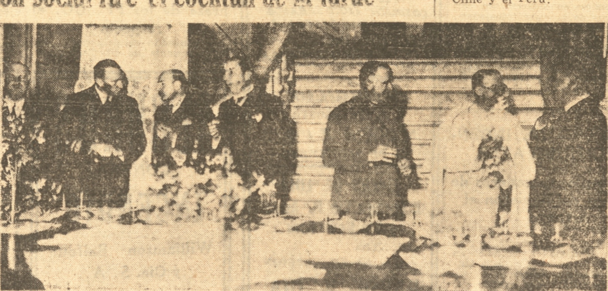
MESA DE HONOR DEL COCKTAIL SERVIDO AYER TARDE EN EL CLUB CONCEPCION