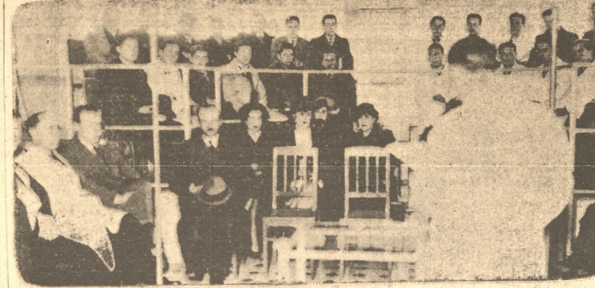
UN ASPECTO DEL HOMENAJE RENDIDO AYER EN EL HOSPITAL A LA MEMORIA DEL PROFESOR DON LUCAS SIERRA