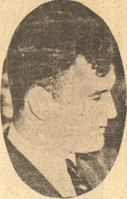
JIMMY BRADDOCK entregó el cetro del box mundial en Chicago

Será exhibida hoy en el Teatro Central en funciones de selecta y nocturna.— Hay interés en la afición por acudir a ver el triunfo del negro y que le dió el cetro del mundo de todos los pesos