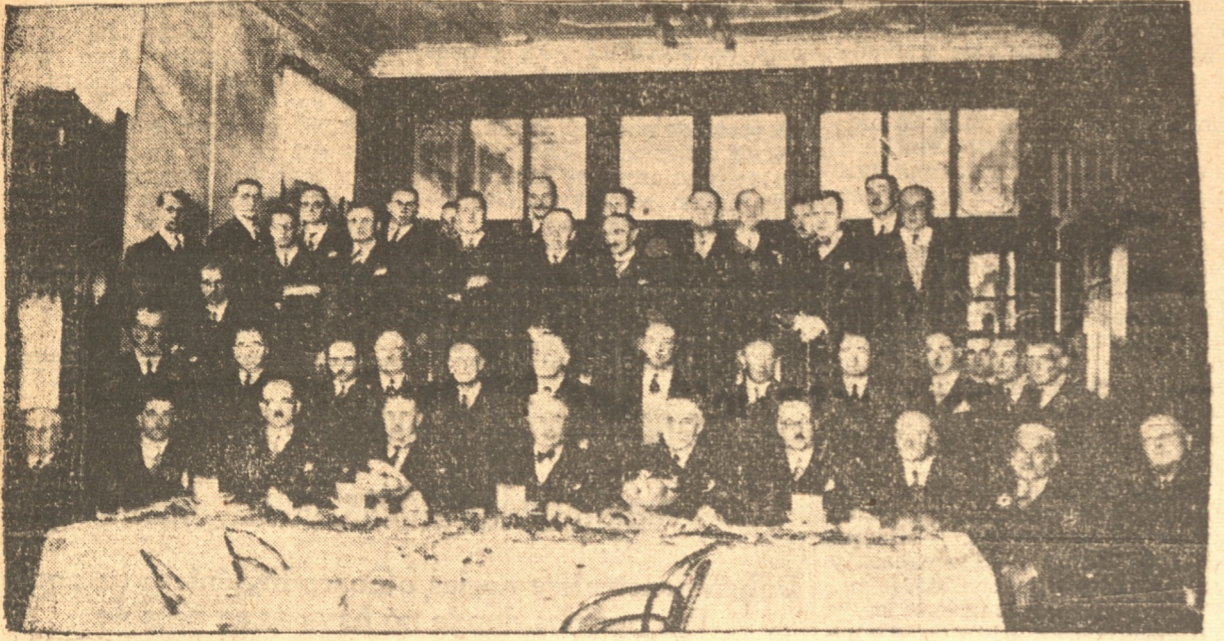
GRUPO DE ASISTENTES AL BANQUETE DE AYER EN EL HOTEL DE FRANCE

A todos estos actos quedan invitados los padres y apoderados de las alumnas; del mismo modo se encarece la asistencia de todas las ex alumnas del establecimiento. Las entradas para la velada se encuentran a disposición del público en Freire 114. El programa para la velada lo daremos a conocer mañana.