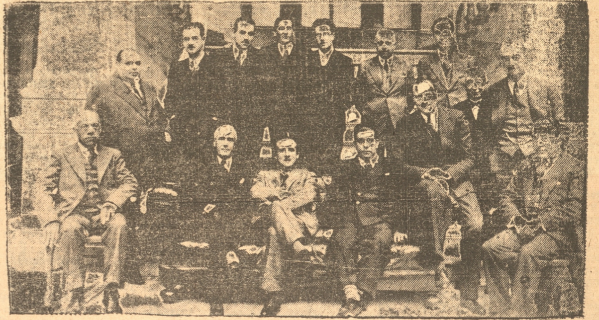
ASISTENTES AL ALMUERZO DE AYER EN EL CLUB CONCEPCION