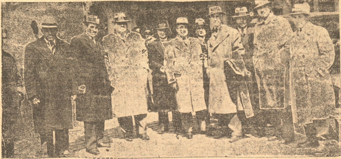
LOS PARLAMENTARIOS CONSERVADORES A SU LLEGADA A NUESTRA CIUDAD