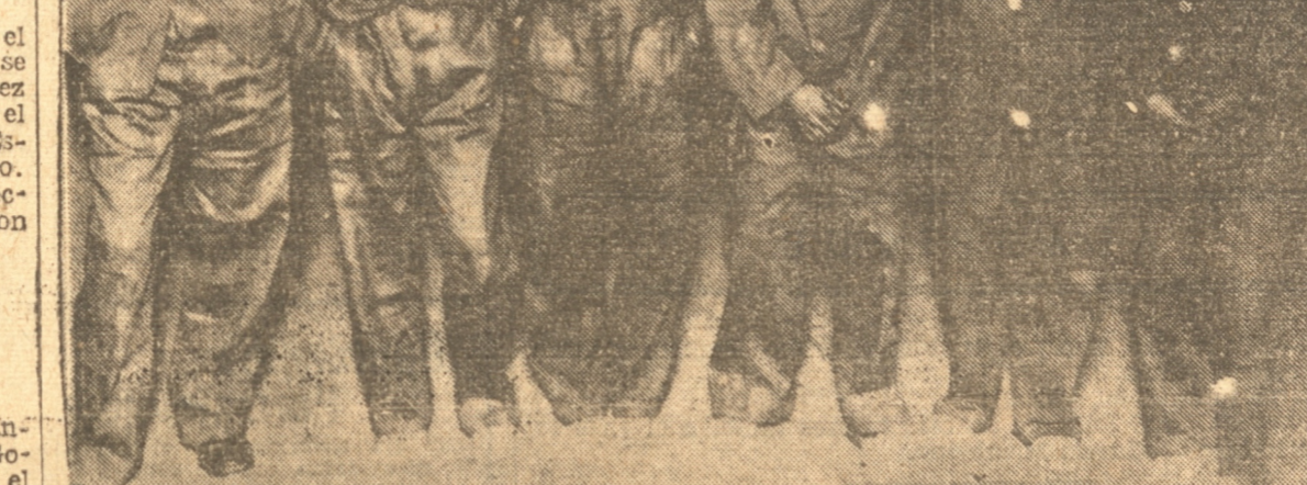
En una de nuestras ediciones anteriores, dimos cuenta de que los jefes de sectores del gremio de lustrabotas, se les había hecho el obsequio de uniformes. Insertamos ahora una fotografía de los favorecidos, en este obsequio.