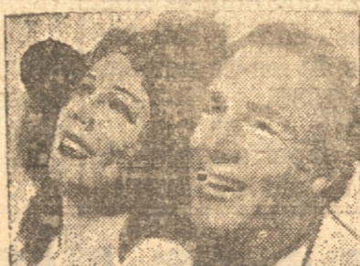
ORO NEGRO fué el regalo que la suerte les ofreció el día de su boda, pero la codicia se alzó contra ellos.

UN FILM MUSICAL DE INTEN SO DRAMATICISMO - HERMOSA MUSICA Y PRECIOSAS ROMANZAS — DIRECCION DE ROUBEN MAMOULLAN — NOTICARIO AEREO UNIVERSAL — VARIEDADES SONORA