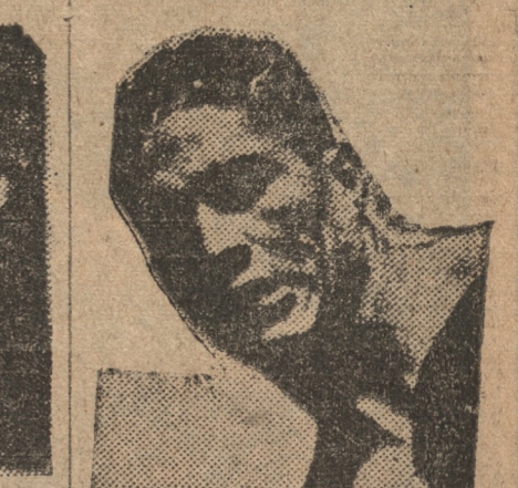
EL CAMPEON CHILENO ARTURO GODOY

MADRID, 13. — (UP). — Al salir de un Consejo extraordinario de Ministros que se celebró hoy, el señor Lerroux desmintió rotundamente los rumores de que este Consejo hubiera sido motivado por discrepancias que serían el preludio de una crisis ministerial.