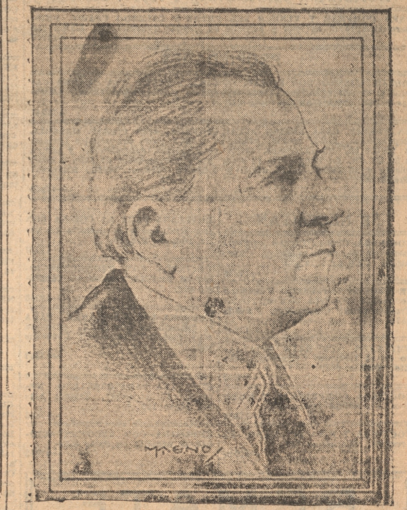
JOSE SANTOS CHOCANO, asesinado ayer en la capital

MOVIDO POR LA VENGANZA, UN INDIVIDUO LE DIO TRES PUÑALADAS. — EL HECHO OCURRIO EN UN TRANVIA. — EL CRIMINAL ESTARIA CON SUS FACULTADES MENTALES PERTURBADAS.