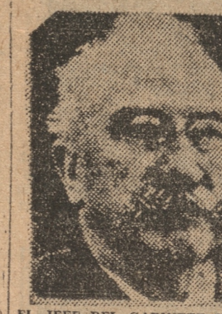
EL JEFE DEL GABINETE ESPAÑOL DON ALEJANDRO LERROUX