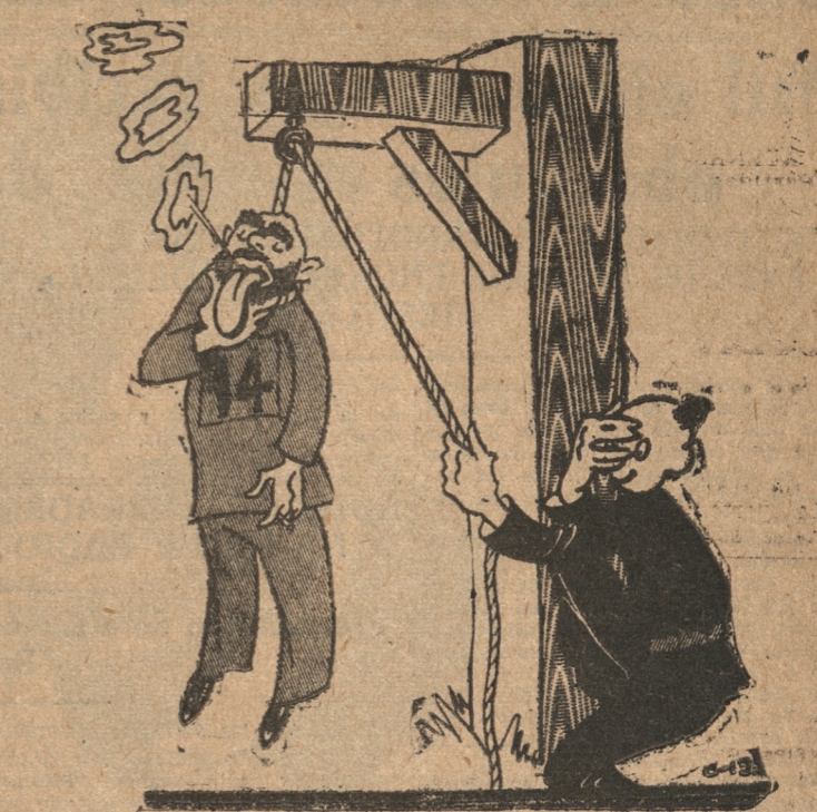
(Del "Romancero de Pino")