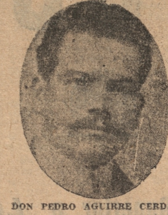
DON PEDRO AGUIRRE CERDA