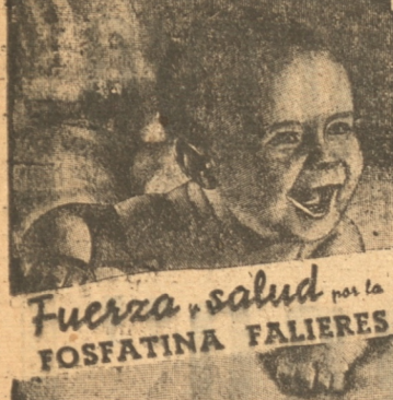
Fuerza y salud con la FOSFATINA FALIERES

De composición científica la Fosfatina Falieres en vitaminas encierra harina y féculas diversas, escogidas y parcialmente digeridas bajo la influencia de tratamientos especiales. Es el alimento ideal de los niños después del destete, de los ancianos y de los convalecientes, a causa de la facultad de su digestión y de sus propiedades fortificantes.