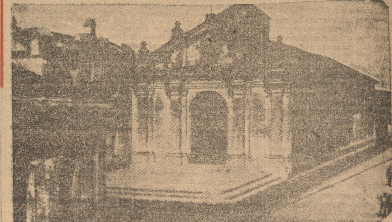
LA PLAZUELA DE LA IGLESIA DE LAS TRINITARIAS

COMITE DE EMPLEADOS Y OBREROS CESANTES PRO COLOMBIANOS. — De orden del señor presidente, y en conformidad con lo acordado en