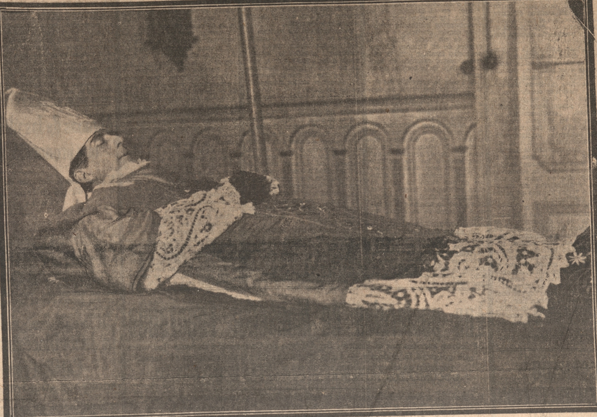
LOS RESTOS MORTALES DEL ILUSTRE EXTINTO, REVESTIDOS CON SUS PARAMENTOS DE OBISPO

A las 18 horas de ayer el Seminario Conciliar cantó el Oficio de Difuntos. El Venerable Cabildo invita