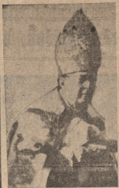
EL EXCMO. SR. FUENZALIDA, CON SUS PARAMENTOS PONTIFICIALES, DURANTE UNA CEREMONIA RELIGIOSA

Vuelto a Chile el señor Fuenzalida, desempeñó inmediatamente en el Seminario de Santiago cátedras tan importantes como la de Castellano, la de retórica y poética, o sea literatura en general y la de Filosofía. Su claro talento y su buen gusto brillaron en el desempeño de estas asignaturas, llegando a ser