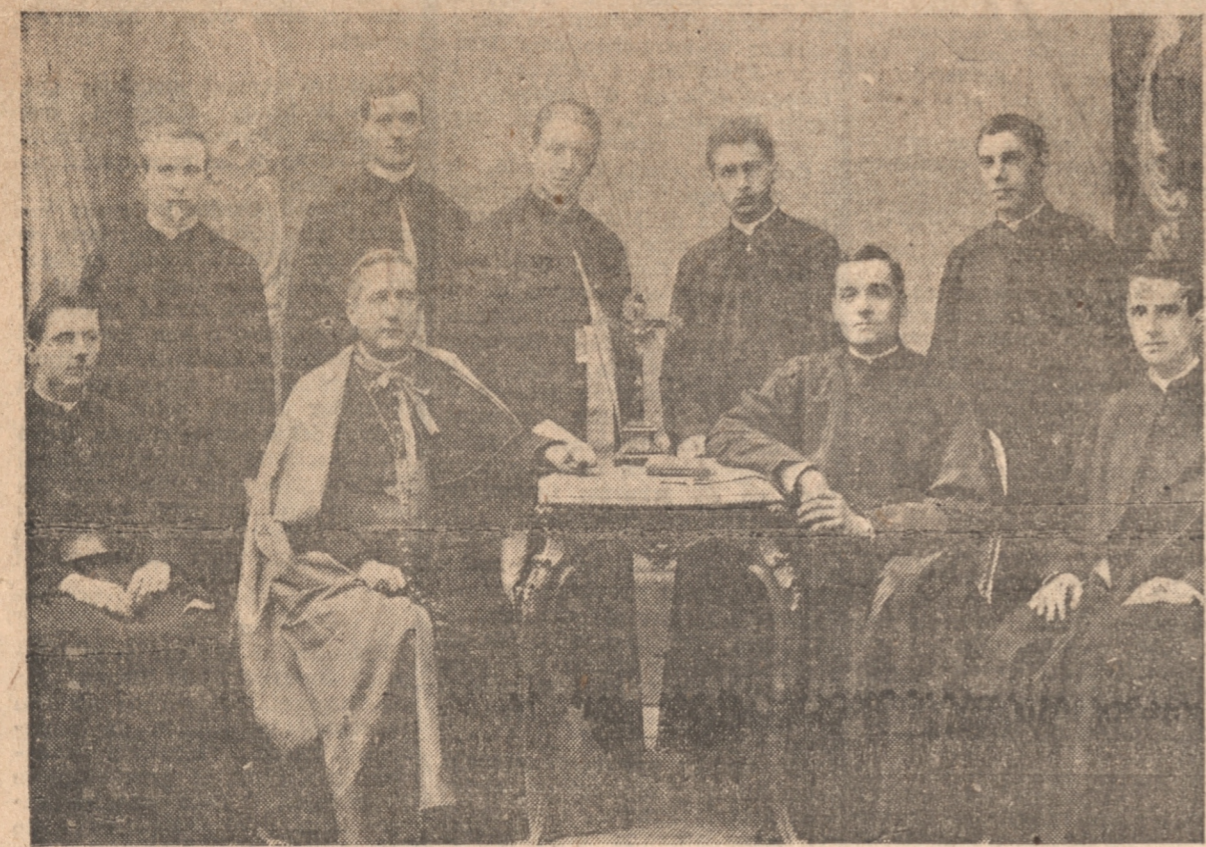
EN EL PRIMER VIAJE HECHO A ROMA POR EL EXCMO. SR. FUENZALIDA, SIENDO YA OBISPO, VISITÓ EN LA CIUDAD ETERNA A LOS SACERDOTES DE ESA DIOCESIS QUE CURSABAN SUS ESTUDIOS EN EL COLEGIO PIO LATINO AMERICANO.

A semejanza de los Padres de la Iglesia cuyos escritos nos dejan asombrados por su doctrina, por su claridad y valor característicos, el Obispo de Concepción se mos-