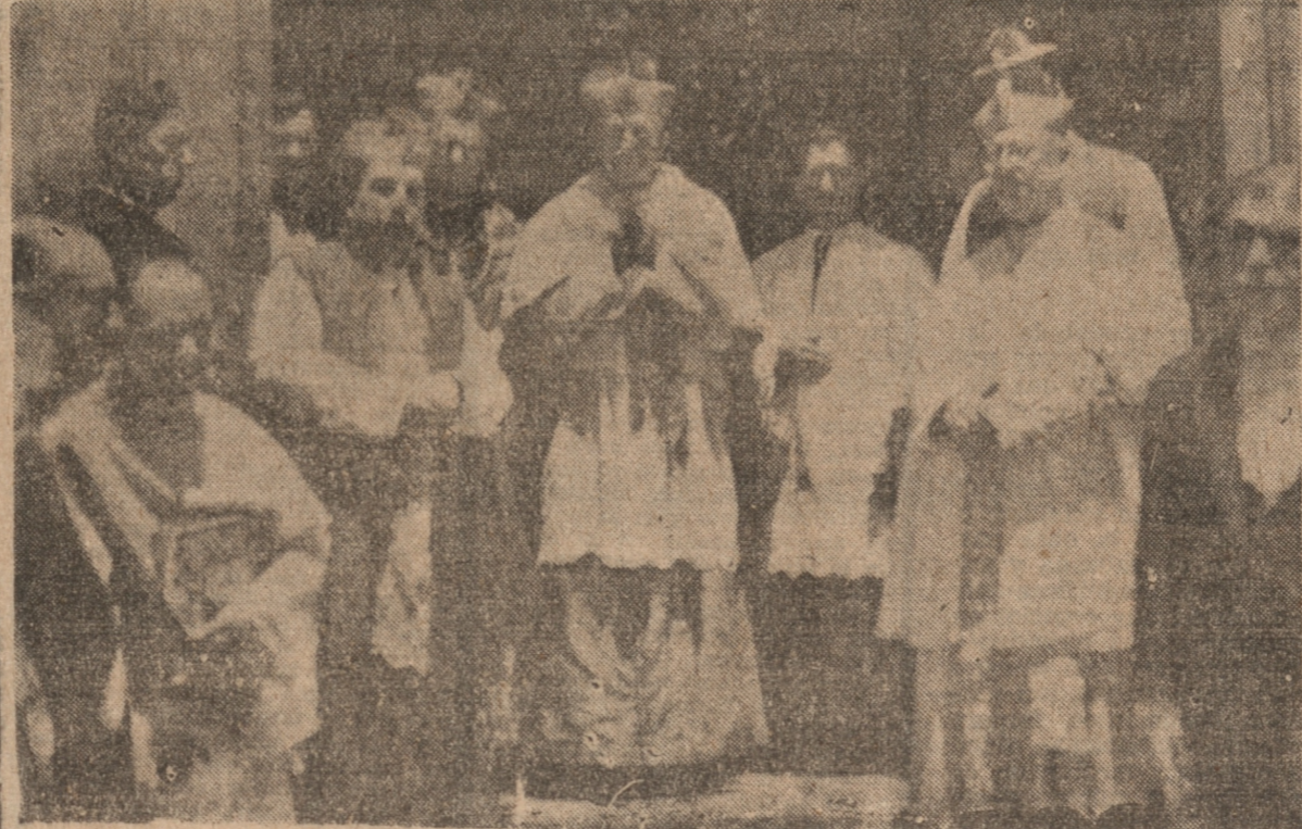
UNA DE LAS ÚLTIMAS CEREMONIAS EN QUE ACTUÓ EL EXCMO. SR. FUENZALIDA SE VE AL PRELADO, ACOMPAÑADO DE OTROS EXCMOS. SRES. OBISPOS, ABANDONANDO LA CATEDRAL DESPUÉS DE LA GRAN MISA DEL CONGRESO EUCHARÍSTICO DIOCESANO VERIFICADO EN DICIEMBRE DEL AÑO PASADO.

Entre las Congregaciones religiosas de mujeres, tenemos no un número menor de almas escogidas prontas a escuchar y obedecer al Pastor, dándose absolutamente a la labor del conocimiento de Cristo, en la escuela, en el Hospital y en el Asilo, y no omitió sacrificios para abrir nuevas Casas de las Religiosas Hospitalarias y