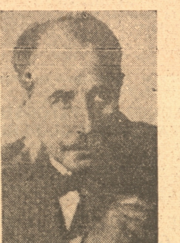
El ilustre poeta Eduardo Marquina, quien interpretará uno de los principales personajes de "En Flandes se ha puesto el sol".

Dada las simpatías que María Guerrero goza en nuestra ciudad el festival de mañana constituirá, a no dudarlo, todo un acontecimiento social y artístico.