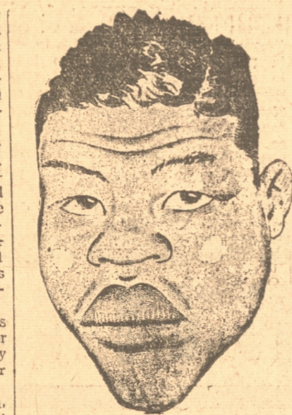
JOE LOUIS rapidez, al romper a Fred Fulton en 31".