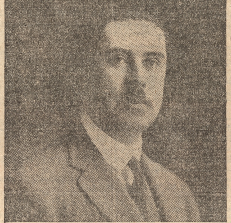
Don Héctor Rodríguez de la Sotta , vigorosa personalidad política, de nuestro país y estadista de sólidos prestigios, que es llevado por el Partido Conservador a la Primera Magistratura de la Nación.