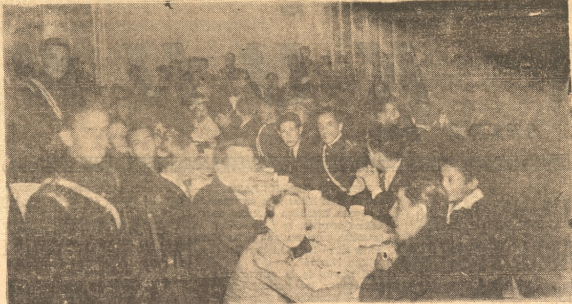
Vista tomada después de celebrarse la sesión solemne en la Tercera Cia. de Bomberos

EN LA MAÑANA DE HOY SERA LA ROMERIA AL CEMENTERIO