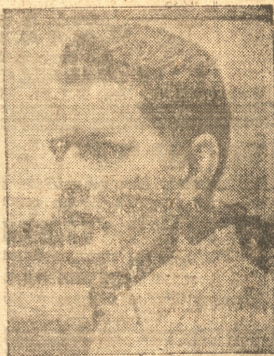
TUNNEY, dice que Schmelling no- queen otra vez a Louis