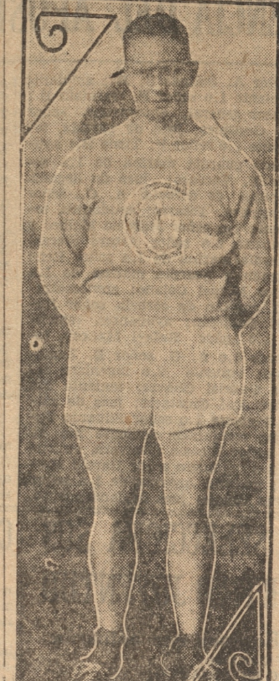
EL GRAN ATLETA DE FAMA INTERNACIONAL, WENZEL, POSA PARA LA PATRIA

Lanzamiento de la bala 1.º — O. Wenzel (U. Ch.) 13,16 metros. 2.º — H. Hoefert (Concep.) 11,73 metros. 3.º — H. Berguen (U. Ch.) 11,25 metros.