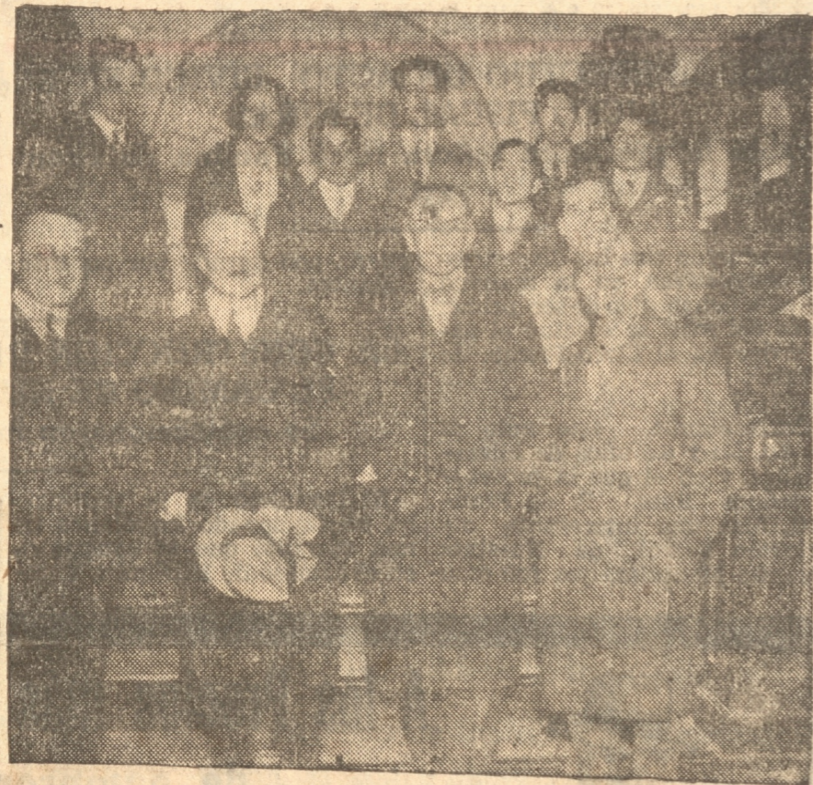
EL SEÑOR INTENDENTE, DON RENATO VALDES, EL RECTOR DEL LICEO NOCTURNO, EL DI-RECTOR DE LA ESCUELA DE DE FARMACIA Y A LIGUNOS PROFESORES

EL CAFE QUE SIRVE PALET ES UNICO EN CHILE