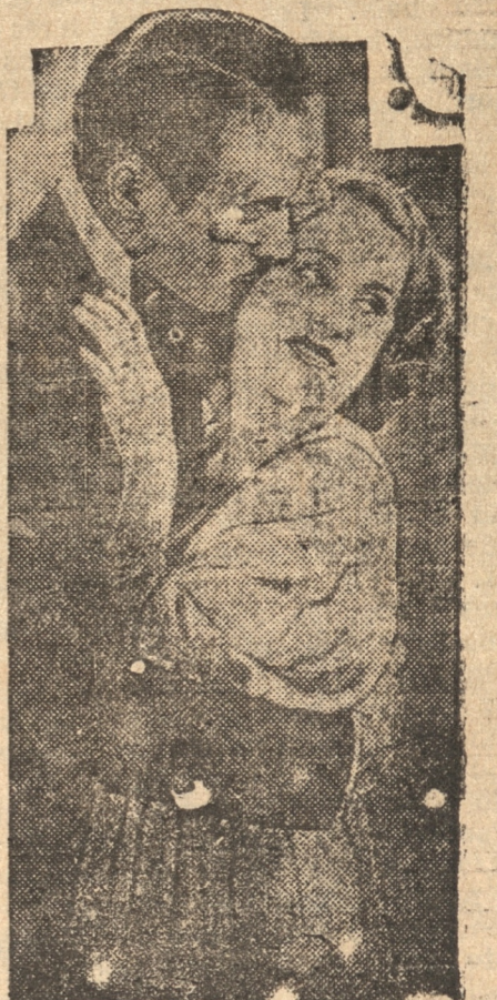
ROD LA ROCQUE and NORMA

La película hablada en castellano que todo Concepción verá entusiasmadísimo!! Una obra de ahora y para siempre