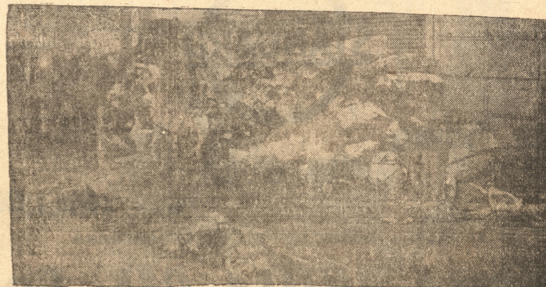
UNA PEQUENA PARTE DE LA MERCADERIA QUE SE SALVO DA COMPLETAMENTE AVERIADA

Ayer mismo el presidente del Club Concepción comunicó este simpático ofrecimiento al directorio del Club Inglés.