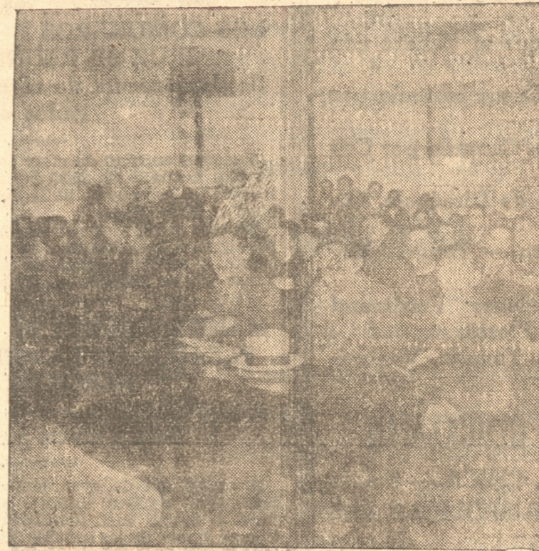
VISTA PARCIAL DE LOS ALUMNOS QUE ASISTIERON AYER A LAS PRIMERAS CLASES