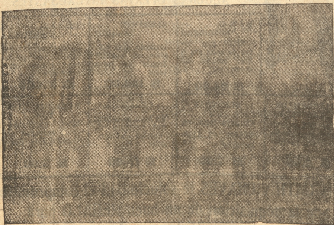
EL EDIFICIO TAL COMO QUEDO DESPUES DEL INCENDIO