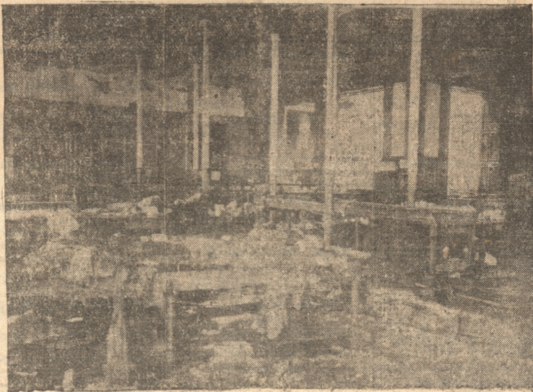
EL INTERIOR DE LA CASA HUTH, DESPUÉS DEL SINIESTRO