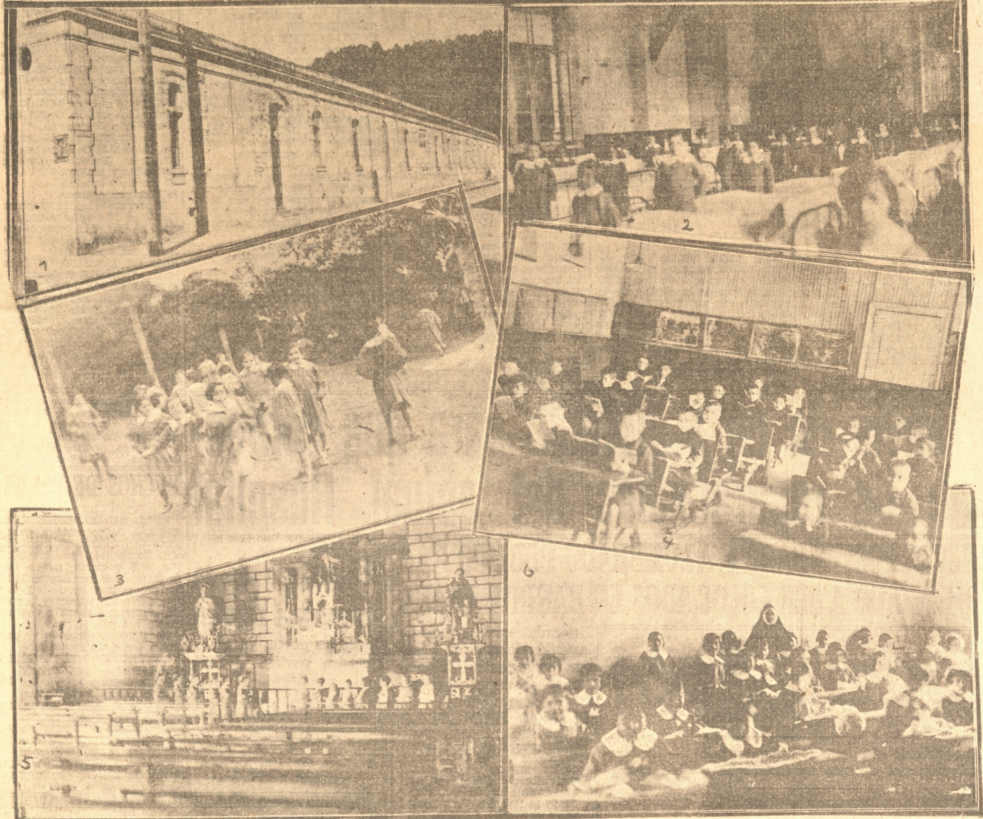
1) El edificio de la Protectora de la Infancia en calle Angol esquina de Chacabuco. — 2) Uno de los dormitorios de los niños. 3) Un grupo de niñas juega en uno de los ratos de recreo. 4) Los huerfanitos tienen su sala de clase y aquí están estudiando. 5) La Capilla del establecimiento es pequeña y un grupo de huerfanitos están orando al pie del altar y 6) Un grupo de huerfanitas aprenden a coser y a ser buenas dueñas de casa para el futuro

La capilla Por aquí tienen la capilla a la entrada. Es pequeña y hermosa. Allí, desde chicos, los asilados y asiladas oyen la santa misa y rezan sus oraciones. Se forma allí el espíritu de esas futuras mujeres y hombres que con la formación moral cristiana llegarán a ser útiles un día a la sociedad. De inmediato podemos darnos cuenta de un dato interesante, todo lo que está a nuestra vista es de material ligero, la mayoría es madera. Existe el, como es ya proverbial en todo el establecimiento un asno blanco. Y con tanto chico.