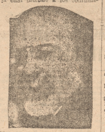
M. LOUIS BARTHOU, Ministro de Relaciones Exteriores

PARIS 9. — (U. P.) — No pudiendo los exaltados llegar a la Plaza de la República, formaron barricadas dentro de la plaza.