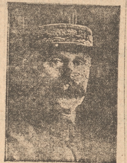
GENERAL PETAIN, Ministro de Guerra

Se estima que estas medidas lograrán llevar la orientación necesaria a nuestros productores para las transacciones de trigo, y será la primera resolución dictada en virtud de la ley que otorga a la Junta de Exportación Agrícola el poder comprador, destinado a regular el comercio agrícola del país.