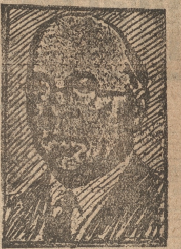
M. ALBERT SARRAUT, Ministro del Interior