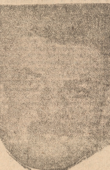
M. EDOUARD HERRIOT, Ministro de Estado sin cartera

PARIS 9. — (U. P.) — A las 16 horas los comunistas comenzaron a filtrarse en la Plaza de la República, pero la policía por precaución arrestó a ciento cincuenta de ellos y allanó a varias decenas.