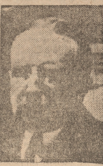
M. ANDRE TARDIEU, Ministro de Estado sin cartera

EL CONVENIO LIBERAL-CONSERVADOR ha producido una reacción en los partidos Demócrata Radical y Social Republicano, por estimarse que el candidato que proclaman los derechistas tendría mayor opción para resultar triunfante, y tendrían como único competidor serio a don Marmaduke Grove, candidato socialista.