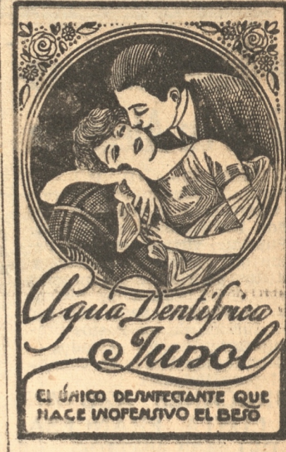
El único desinfectante que hace inofensivo el beso