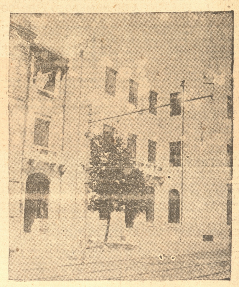
Edificio donde funcionan las oficinas centrales de la Universidad de Concepción