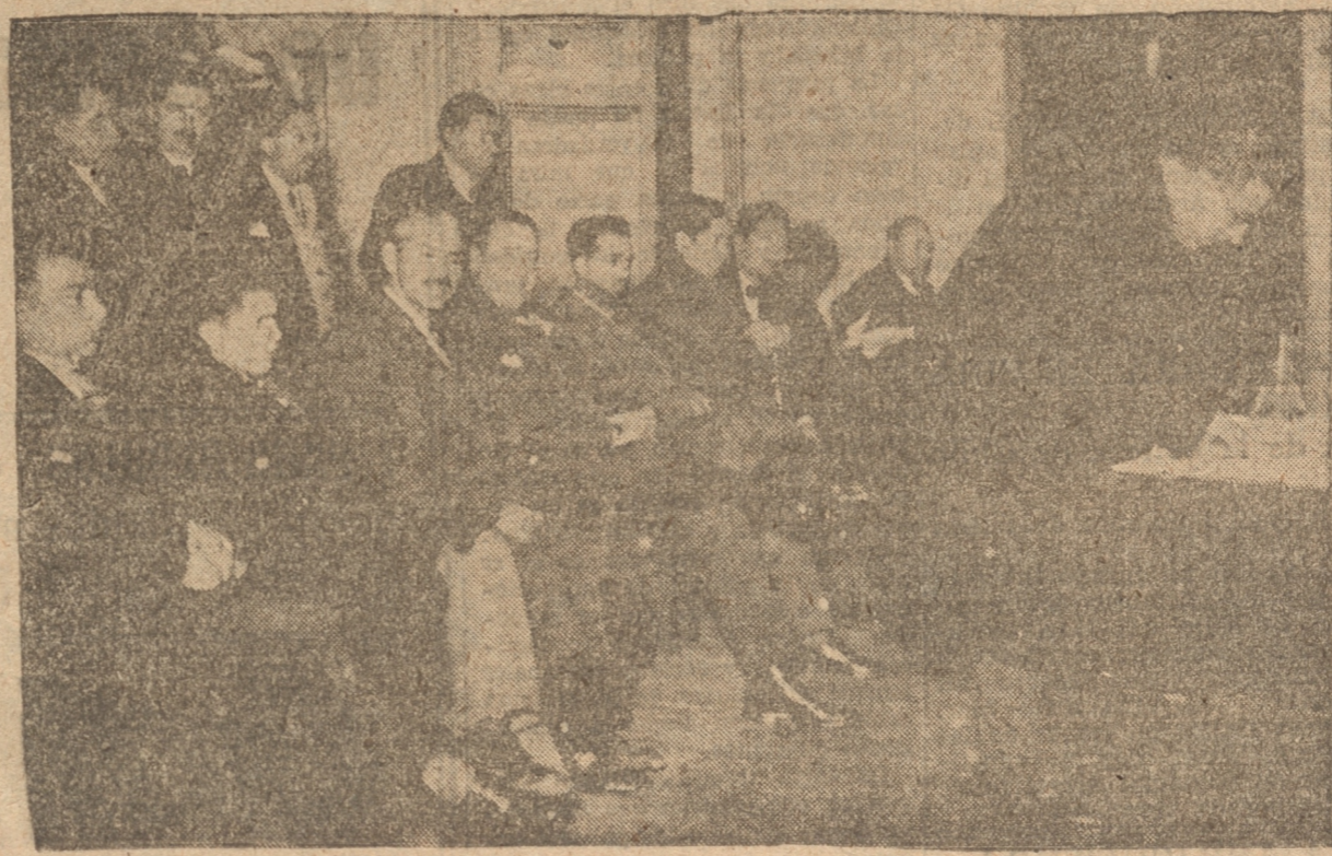
LAS PERSONAS QUE PRESIDIERON LA CONCENTRACION DE AYER EN EL TEATRO CONCEPCION

NUMEROSAS INSTITUCIONES DE OBREROS Y EMPLEADOS Y PUBLICO EN GENERAL ASISTIO A ESTA CONCENTRACION. — HICIERON USO DE LA PALABRA ALGUNOS PARLAMENTARIOS.-LOS ORADORES. — TELEGRAMA QUE SE ENVIO A S. E. EL PRESIDENTE DE LA REPUBLICA