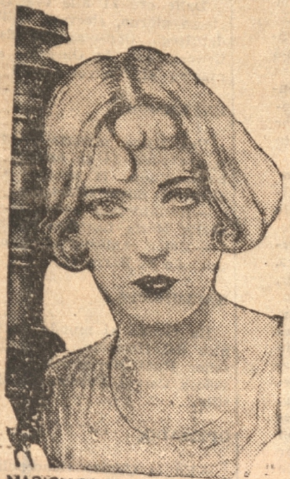
MARION DAVIES en "THE DATSY"

Un formidable Programa Doble con sus artistas predilectos Bellas Canciones — Comicidad — Romance — Diálogos en Castellano