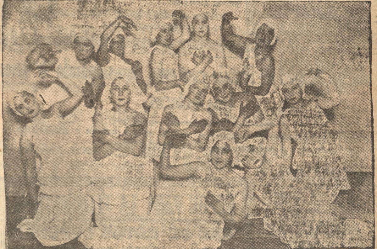
SEÑORITAS QUE PARTICIPARON EN UNO DE LOS NUMEROS

horrorosa catástrofe financiera. Cuando no se consideraron, ni los principios políticos, ni las orientaciones morales; cuando fracasaban todos los esfuerzos para encauzar la administración; cuando todo se derrumbaba; cuando la república ante este espectáculo no daba muestras de vida, resuena en el horizonte, como una clarinada, la frase apocalíptica de que eran portavoces los estudiantes universitarios: "PUEBLO: levántate y anda." Y entonces, las fuerzas vivas de la sociedad chilena, al parecer adormecidas, se sacuden, despiertan, se mueven, accionan, y se adhieren entusiastamente a este movimiento universitario, que se lanza a la vanguardia de la lucha, sin más armas que sus nobles ideales, sin más escudo que sus pechos generosos. Y cuando corre la sangre de las primeras víctimas, enciende-