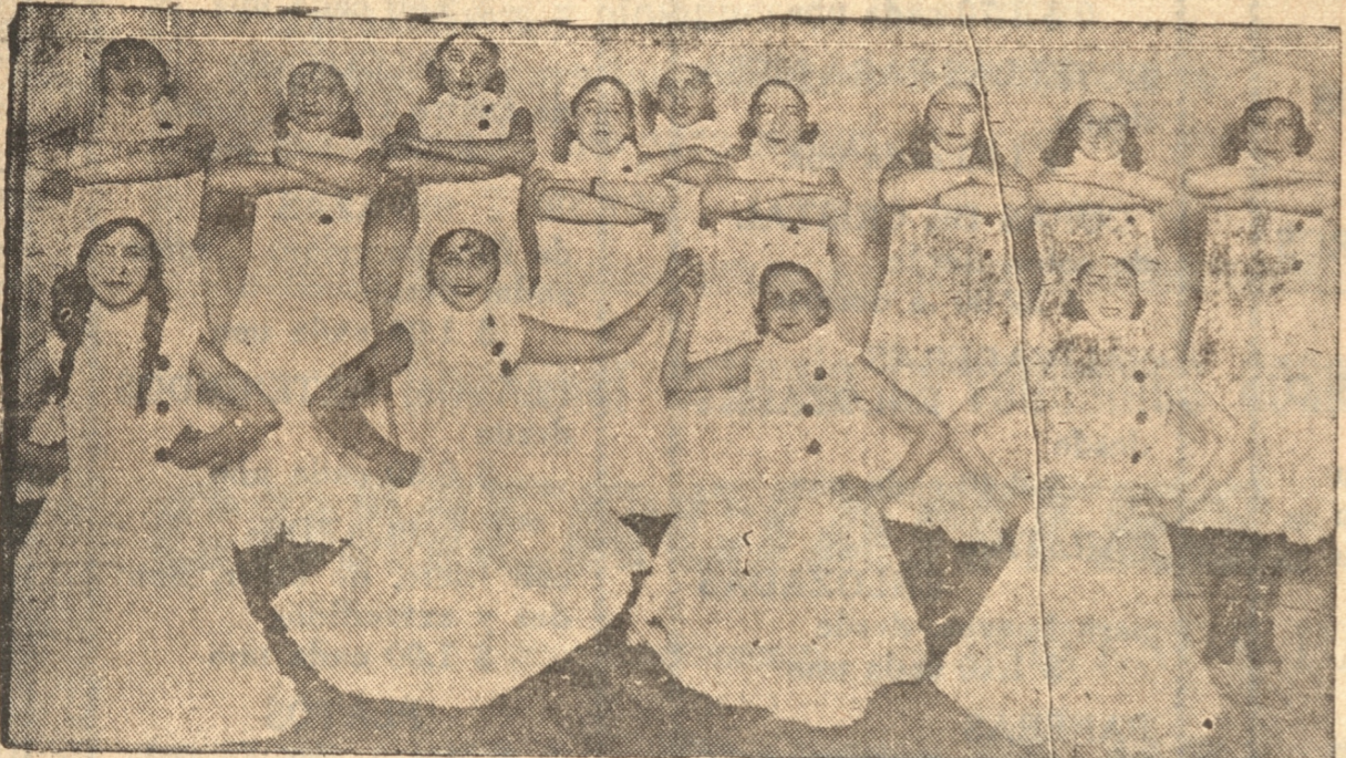
LAS SENORITAS QUE TOMARON PARTE EN LOS BAILES RUSOS

cieron por una concepción amplia de sus deberes, para quienes no miraron en torno suyo buscando compañía, tiene este homenaje la significación hermosa de toda comprensión. Hoy, que se ha justificado ante Uds. la existencia de este núcleo de almas jóvenes, unidas bajo un sólo ideal, recibimos lo que generosamente habéis llamado un tributo, no precisamente como tal, sino como un estímulo por lo que deberemos hacer más tarde. Muchas veces hemos dicho que nuestro movimiento fué puro, pero hay que repetirlo una