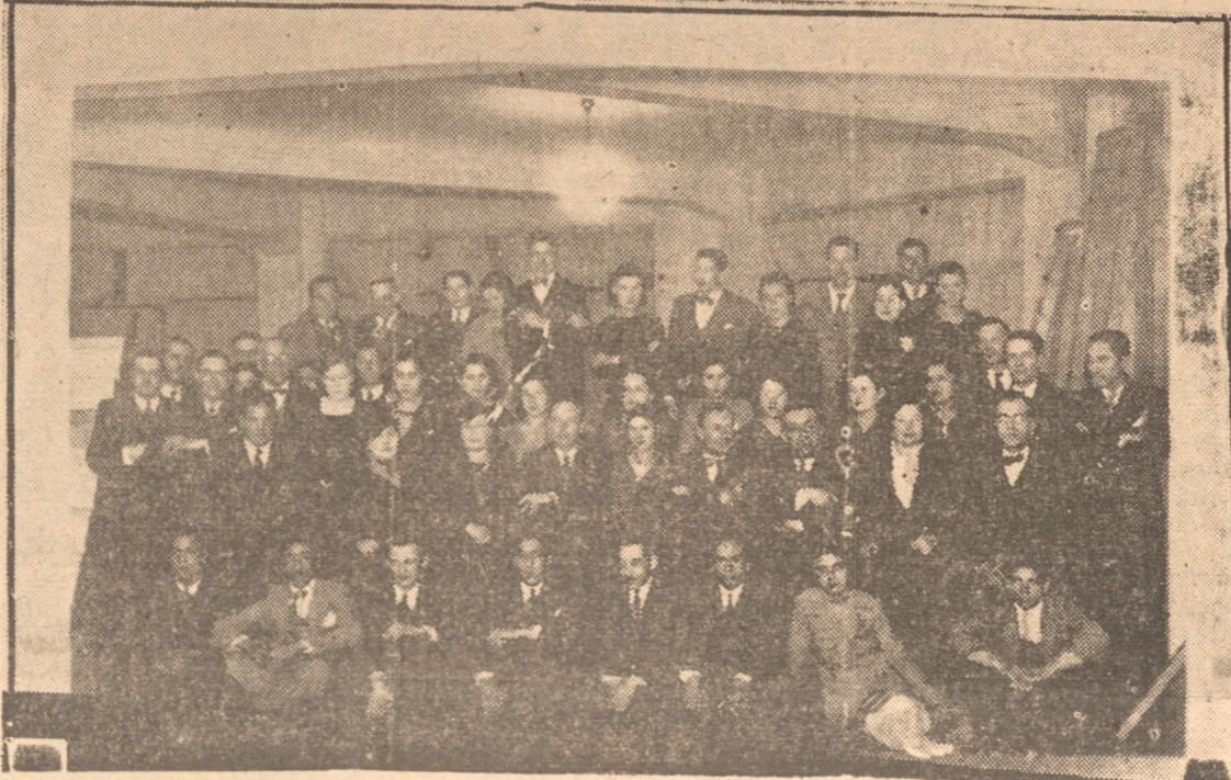
LOS ASISTENTES AL VERMOUTH DE AYER EN GATH Y CHAVES

Señores directores de La Patria y El Sur y demás amigos periodistas, sirvanse aceptar también nuestras sinceras gracias por la excelente acogida y esmerada atención con que nos han distinguido.