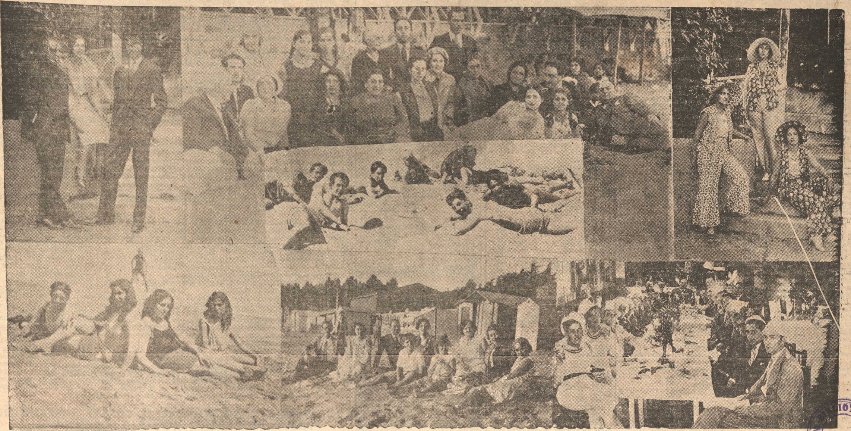
Aún cuando el calor ya está alejándose, quedan veraneantes. — He aquí algunas informaciones gráficas recogidas por los fotógrafos de LA PATRIA en Tomé durante los últimos días.