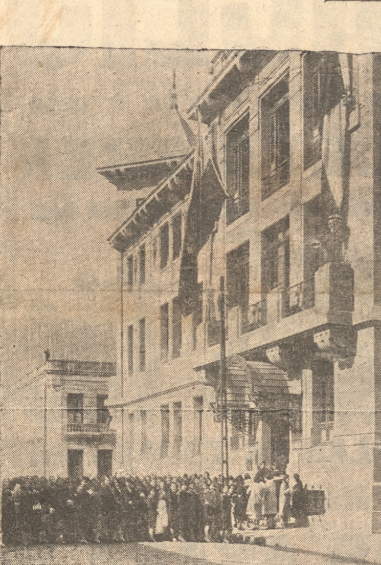
LAS ALUMNAS DEL LICEO FISCAL DE NIÑAS FRENTE AL ESTABLECIMIENTO EN LOS MOMENTOS DE JURAR LA BANDERA.— AUTORIDADES, PROFESORADO Y ALUMNADO EN EL LICEO FISCAL DE NIÑAS

Los alumnos juraron la bandera y un profesor les dirigió la palabra, ante las distintas autoridades, padres, profesorado y todos los alumnos.— En el Liceo Fiscal de Niñas reunió especiales solemnidades.— Estuvo presente el señor intendente de la provincia.— Las alumnas cantaron la Canción Nacional frente al establecimiento.— Dos profesores dirigieron la palabra a las alumnas