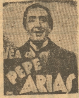
El más perfecto actor de habla latina.

6.45 WARNER BROSS presenta el simpático film, de 9.45 primaveral humor y exquisito romance: Juventud, Música y Alegría DICK POWELL PRISCILLA LANE REGIAS ORQUESTAS — CANCIONES, ETC.