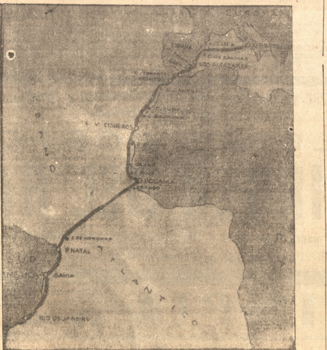
LA GLORIOSA RUTA SEGUIDA POR LOS AVIADORES