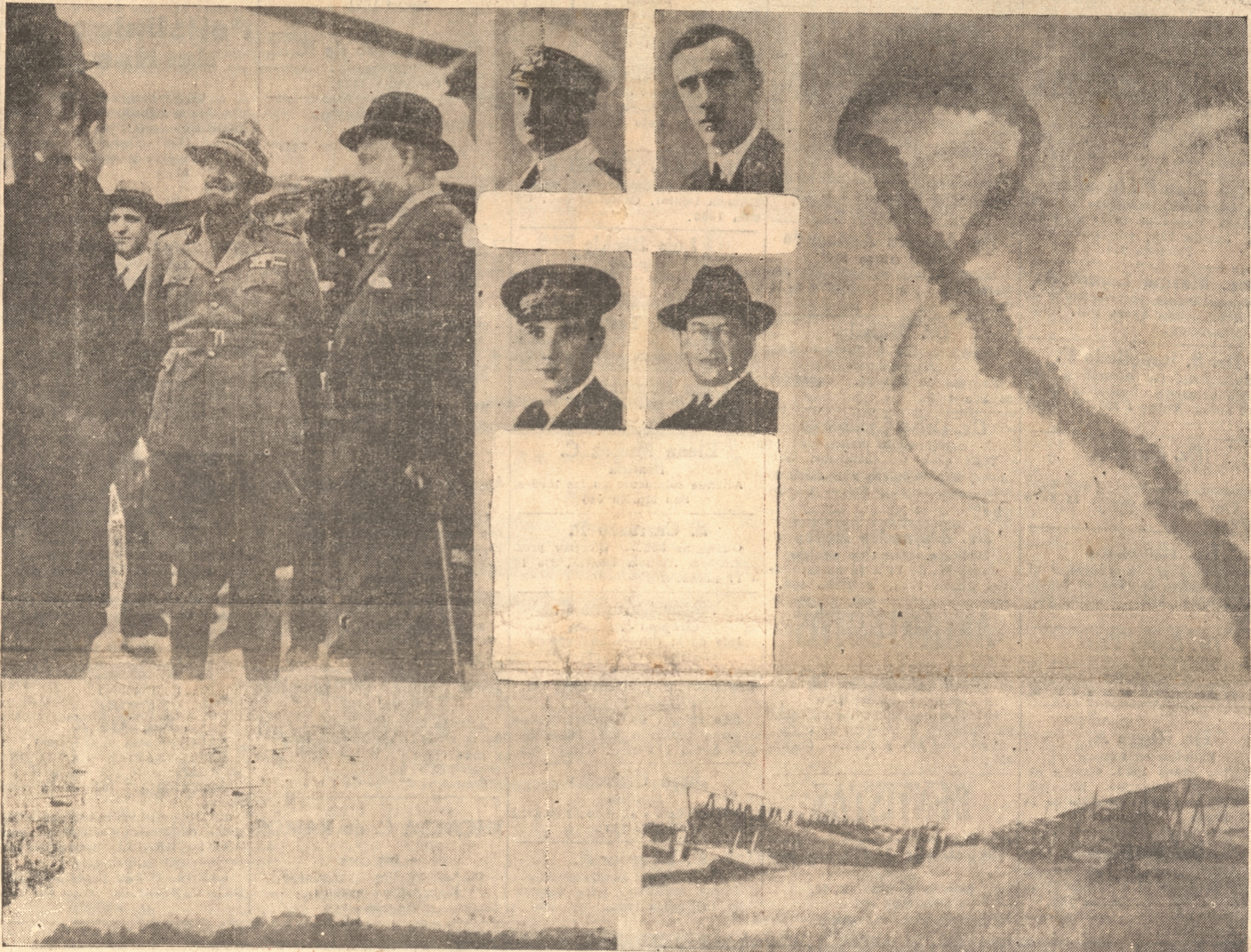
1) El infatigable Italo Balbo, al mando de la escuadrilla italiana, con el comandante Umberto Nobile, as de la aviación italiana, piloto. — 4) Durante las últimas maniobras aéreas, uno de los aparatos. — 6) Comandante Fausto Cecconi, en el Brasil. — 7) Los aviones italianos. — 8) una escuadrilla italiana organizada para emprender un vuelo colectivo, uno de esos vuelos que en este año pasaron bien la travesía del Atlántico, desde el Estado Mayor de Aeronáutica, que forma parte de la escuadrilla que comanda Balbo, a cuyo cargo está la recepción del progreso de las alas de Italia el nombre de la aviación de

ONCE AVIONES PASARON UN VAPOR Natal, 6. — (UP). —