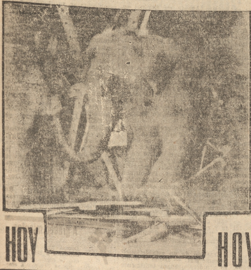
Es una maravilla de belleza espectacular y de intensa emoción.

Teatro DANTE HOY - Selecta 18.45 - Noche 21.45 FOX Presenta un magistral suceso intensamente impresionante filmado en un ambiente de terror y ferocidad. — Un romance nacido entre amenas y todas fibras entrecruzadas. — FOX Un Suceso